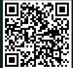
دليل الخريجين والخريجات