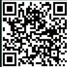
خارطة مواقع السيارات